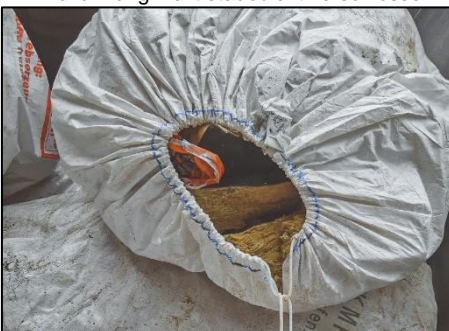
Einfüllöffnung nicht staubdicht verschlossen

Bei Big Bags, die so oder ähnlich abgegeben werden, stellen wir die Nachbearbeitung mit 25,00 € in Rechnung.